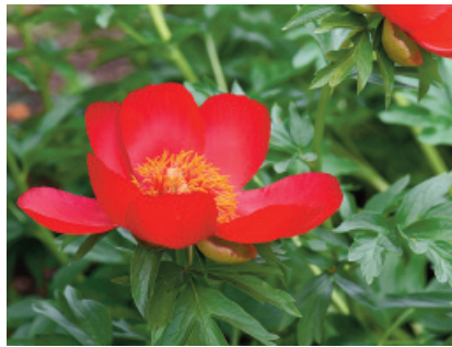
Romania: Peonia ( Paeonia peregrina )