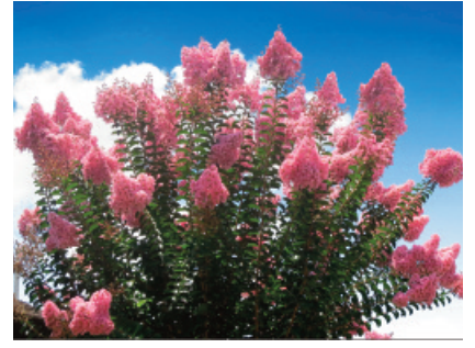
Bulgaria: Mirto Crespo ( Lagerstroemia indica )