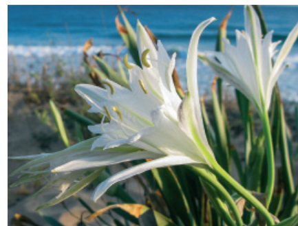
Albania: Giglio di Mare ( Pancretium maritima )