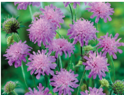
Macedonia del Nord: Ambretta ( Knautia macedonica )