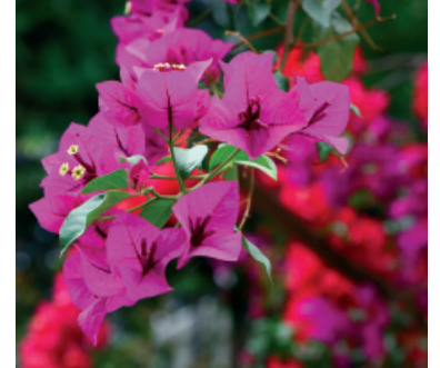
Grecia: Bouganville ( Bougainvillea spectabilis )