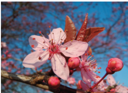
Serbia: Pruno ( Prunus domestica )