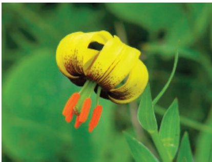
Bosnia Erzegovina: Giglio bosniaco ( Lilium bosniacum )