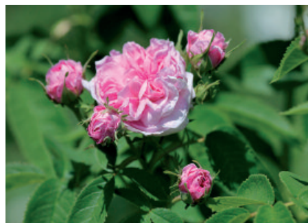
Marocco: Rosa di Damasco ( Rosa damascena )