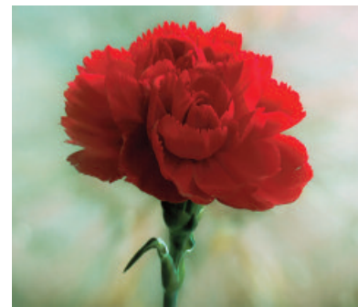
Spagna: Garofano ( Dianthus caryophyllus )