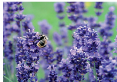
Portogallo: Lavanda ( Lavandula )